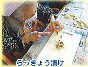
らっきょう漬け 包丁使い上手です