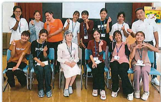
▲6月1日職員研修会にて ミャンマー特定技能生の12名が揃いました

現在の日本は、少子高齢化が加速し、労働人口も減少しているため、人材の確保が非常に困難な時代となっています。人の手が必要な介護の職場において、明るく元気な彼らの力は必要不可欠なものとなっています。彼らを慈しみ、お互いに学びながら、高齢者の方々により手厚いお世話ができますよう、力を合わせていきたいと思ひます。