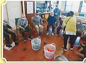
～あじさいのミニ運動会～ 身体を動かして赤と白で対決です