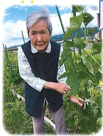
お野菜を育てました 大きくなったよ