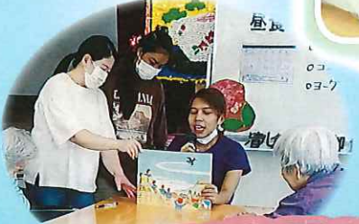
ミャンマーの職員さんが紙芝居に挑戦しました!