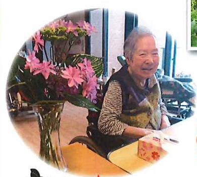
ひじり園の桜 毎年きれいです 花見に行きました