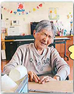
楽しい レクレーション!!