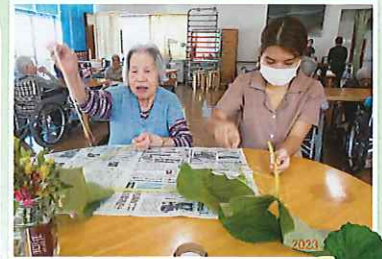
フキの皮むきがお上手!