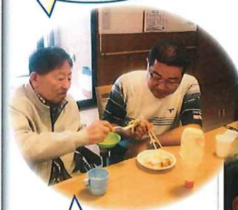
1階と2階で おやつ会をしました