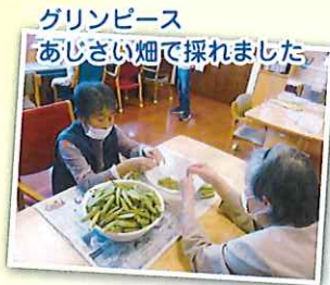
グリーンピース あじさい畑で採れました