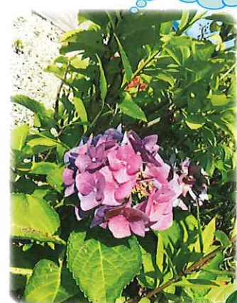
今年も園庭に 沢山のあじさい が咲きました