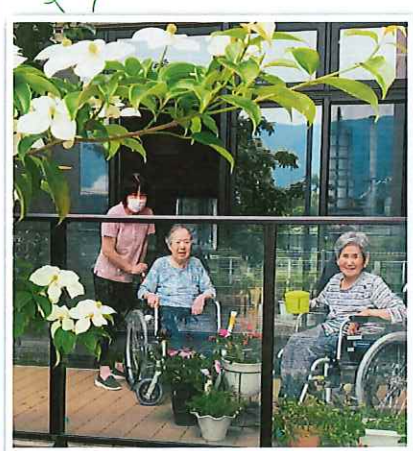
「おやつの間 にテラスにて」