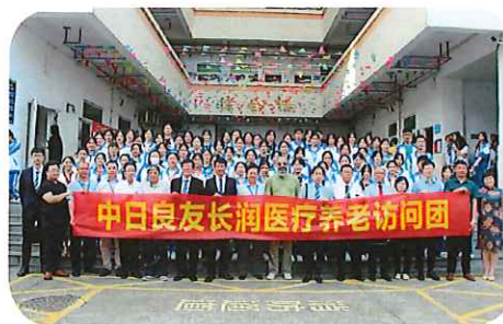
▲6月5日～11日、 中国海南島の看護学校を視察しました