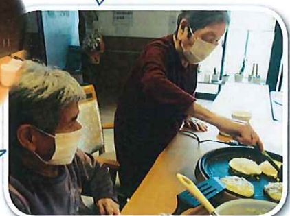
おこのみ焼き 作ったよ！