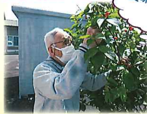
美味しいジャムを 作るぞ～♪