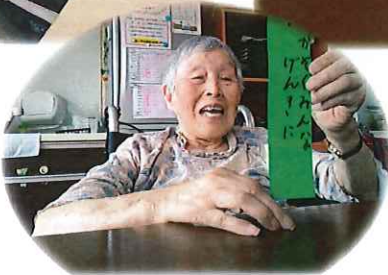
家族を思い 短冊に願いを 込めて♡