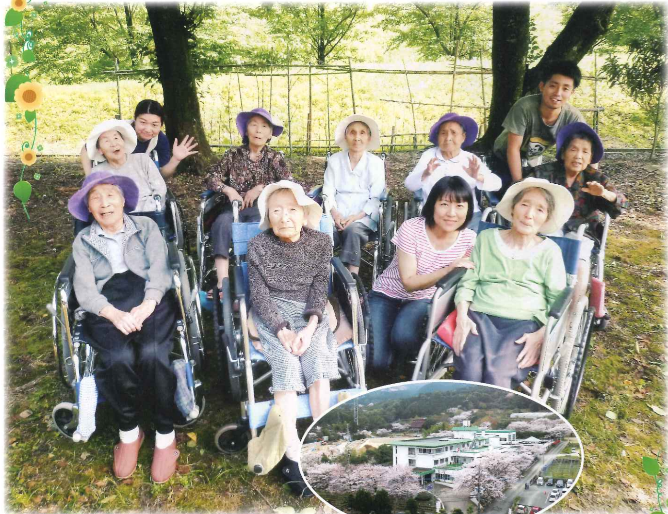
▲桜の綺麗な季節に(株)九電工様にドローンでひじり園を撮影していただきました。