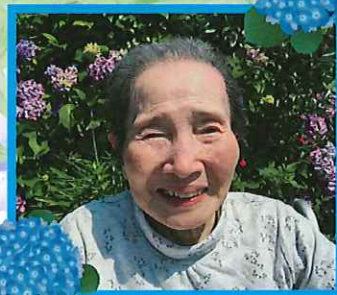
園庭のあじさいの前で パチリ！