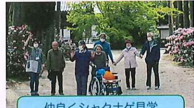
仲良くシャクナゲ見学