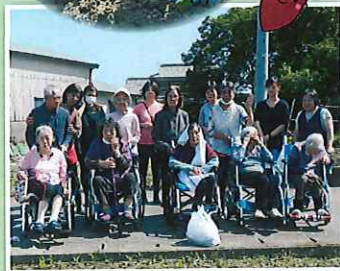
▲さつまいもを植えました。 秋の収穫が楽しみ♪