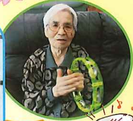
楽器を使って 音楽会♪