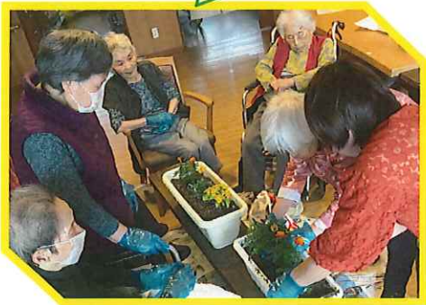
皆んなでお花を植えました。