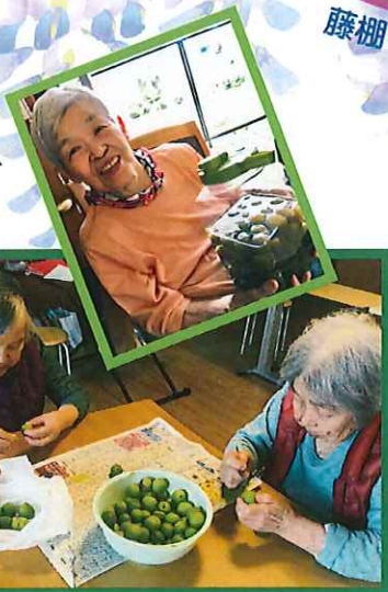
梅ジュースを作りました。