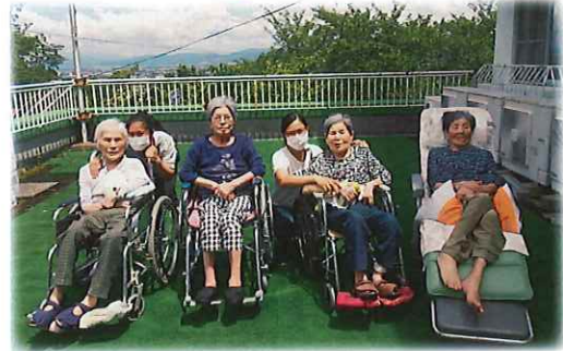
青空の下は気持ちがいいわー♪