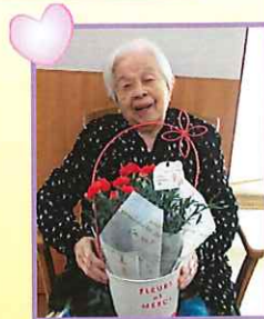
母の日に お花を頂きました！