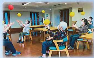
気持よかけん あなたたちもどげんね？