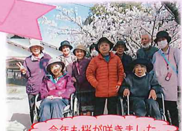
今年も桜が咲きました。