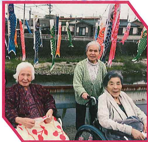
鯉のぼりを見に 行きました。