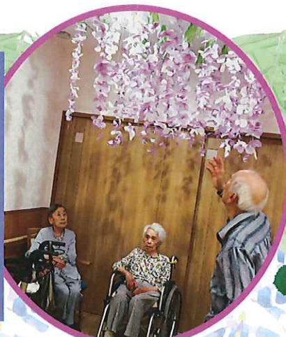
藤棚を作りました。