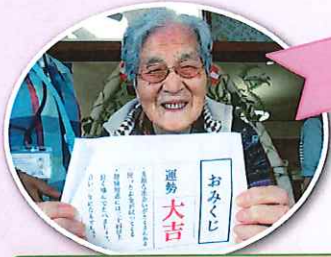
今年も良いことがありますように！