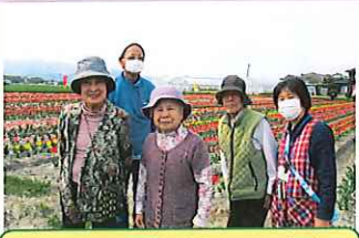
チューリップも綺麗でしたね。