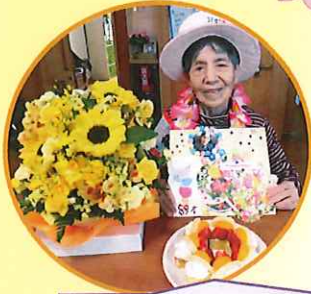
お誕生会♡ みんなでお祝いしましょう！