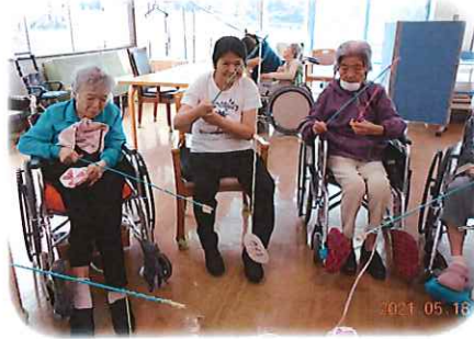
ゲームに挑戦！うまく出来るかな？