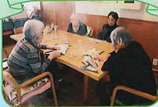
感染予防をしながらレクリエーション♪