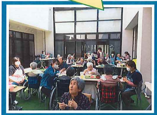
中庭でおいしい食事をいただきました。