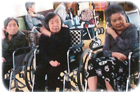
肩をたたきましょう タントントン