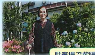
駐車場で紫陽花を見つけたよ