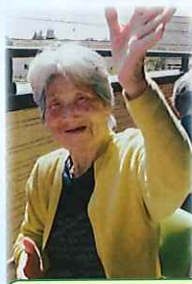
天気がいい日は ベランダで日光浴