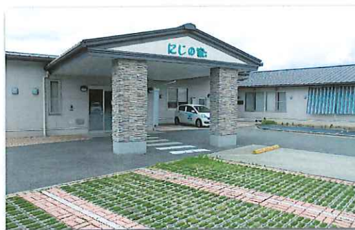
所在地：うきは市吉井町八和田 876-1